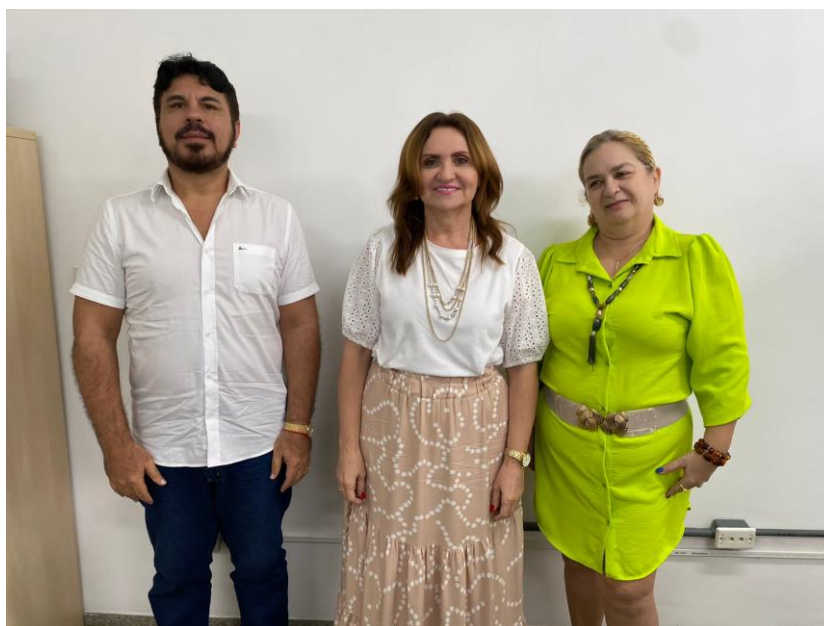
Quadro I – Informação dos Dirigentes da PRPG