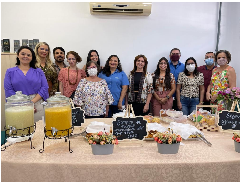
Figura 6a- Equipe da PRPG