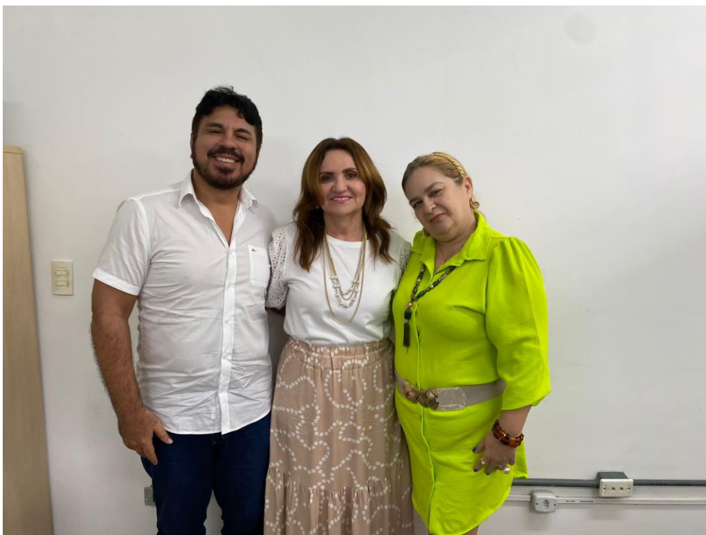
Figura 6b - Pró-Reitora e Coordenadores Stricto sensu e Lato sensu .