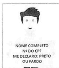
Figura 3. Modelo de Autodeclaração para o vídeo.