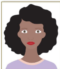
Figura 1. Modelo de Foto Frontal