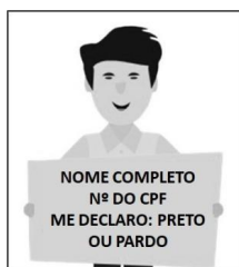
Figura 3. Modelo de Autodeclaração para o vídeo.