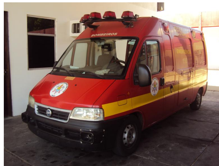
Ambulância do Grupamento de Resgate