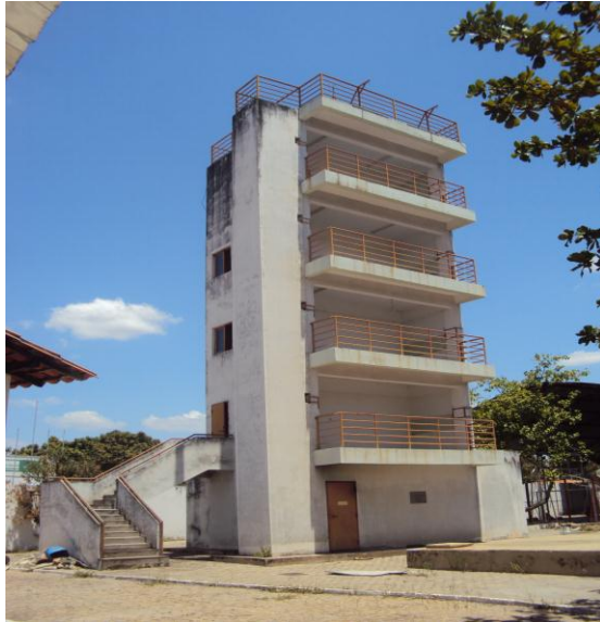
Torre de treinamento do CBMEPI