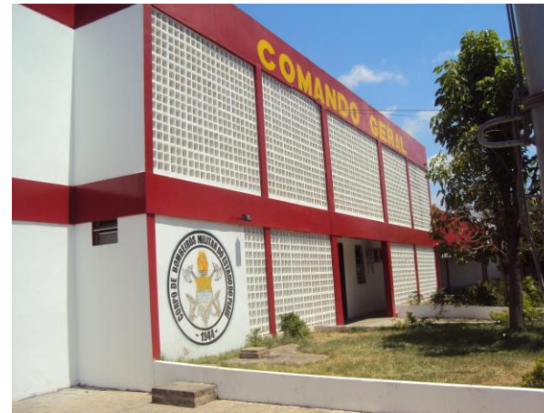
Comando Geral do CBMEPI - Av. Miguel Rosa em Teresina