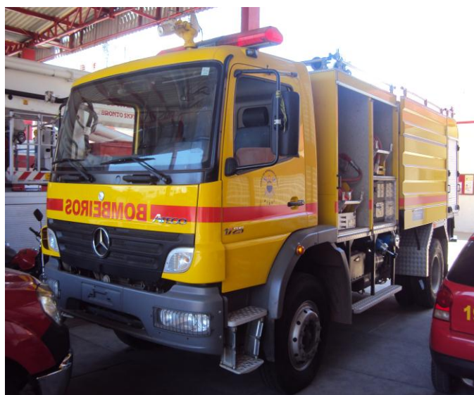
Viatura de Combate a incêndio em aeroporto: 3 mil litros de água