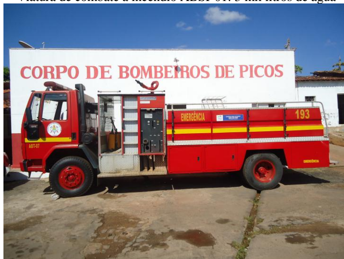
Viatura de Combate a incêndio ABT-07