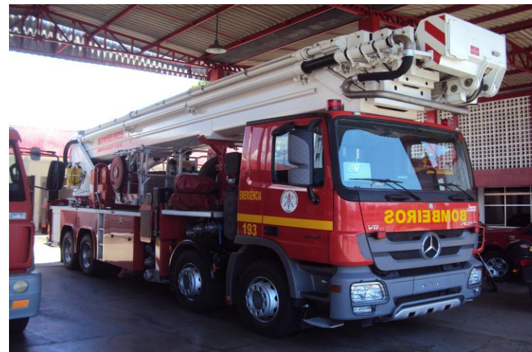
Viatura Plataforma Mecânica - altura máxima de 68 m