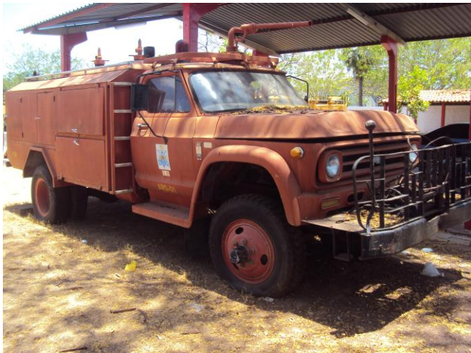
Viatura de Combate a incêndio ABT-01 de 1969