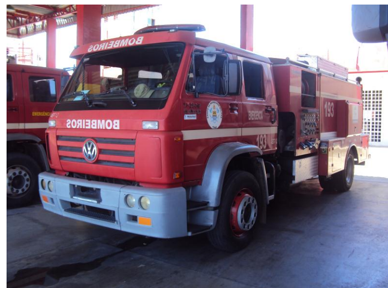
Viatura de combate a incêndio ABT-12: 5 mil litros de água