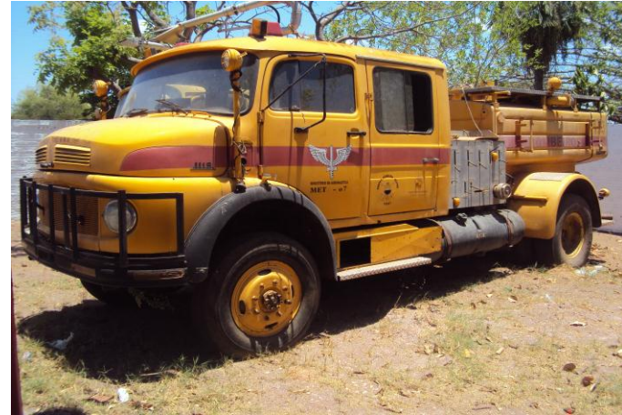
Viatura de Combate a incêndio METZ-015 de 1967