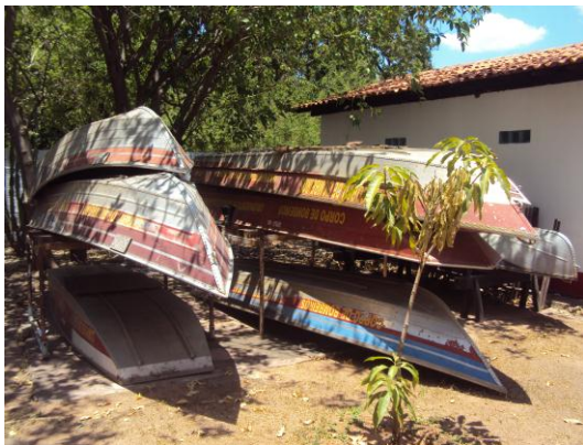
Lanchas para transporte aquático