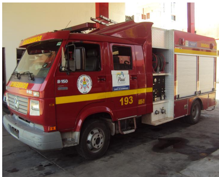
Viatura de combate a incêndio ABSI-01: 3 mil litros de água