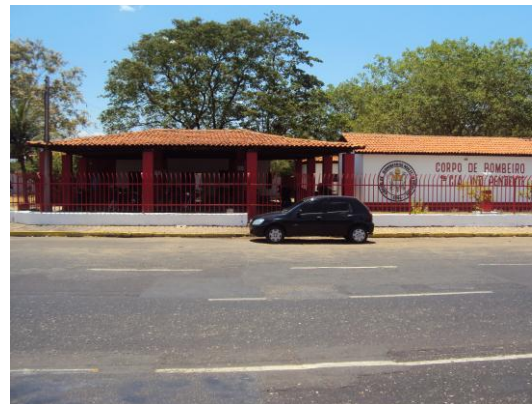
Quartel de Busca e Salvamento na Av. Maranhão em Teresina