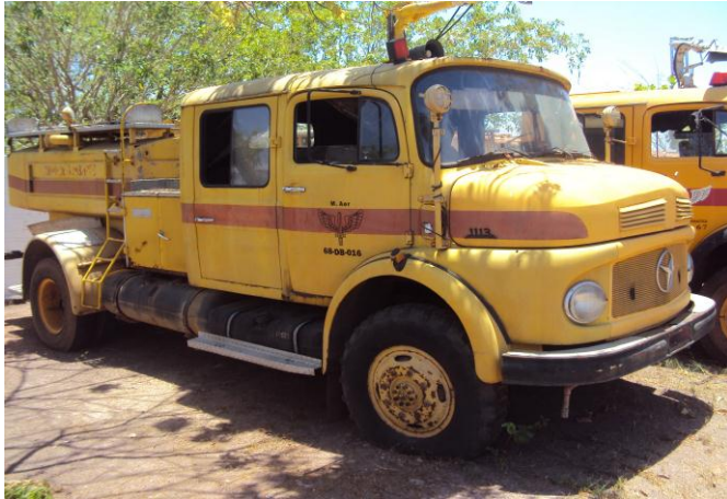
Viatura de Combate a incêndio METZ-016 de 1968