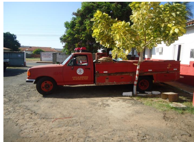
Viatura de Combate a incêndio ABS-04 de 1992