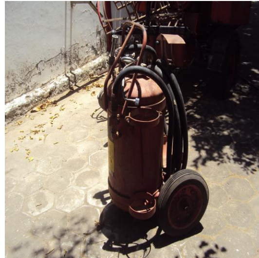
Carrinho para transporte de aparelho extintor