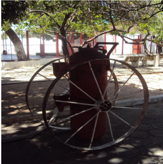
Carro manual de combate a incêndio