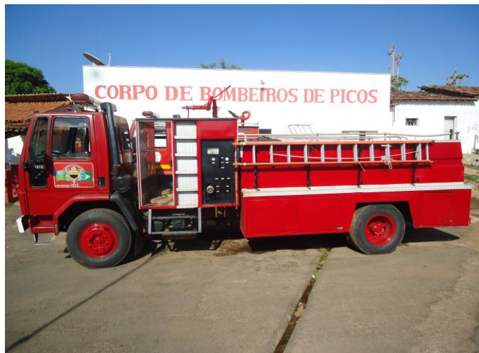
Viatura de Combate a incêndio ABT-08