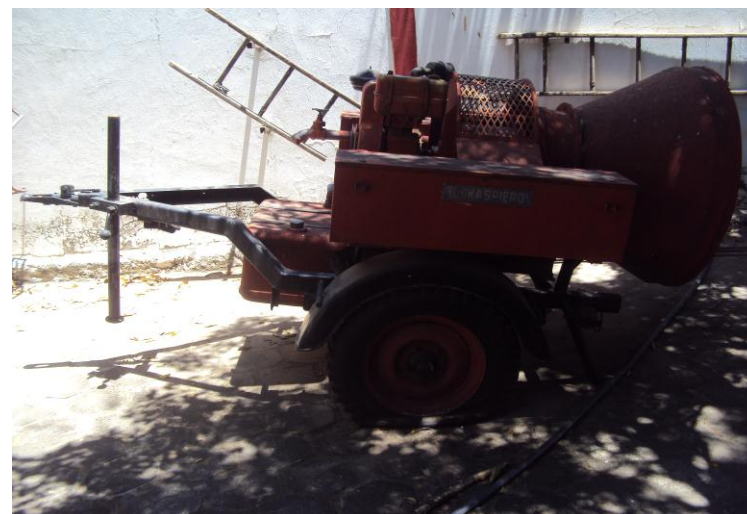
Corrico: carro manual de combate a incêndio