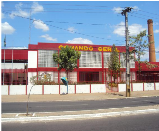
Comando Geral do CBMEPI - Av. Miguel Rosa em Teresina