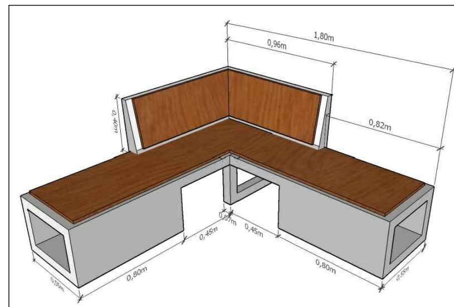
BANCO PARA ÁREA DE DESCANSO PERSPECTIVA – NOVA PROPOSTA SEM ESCALA