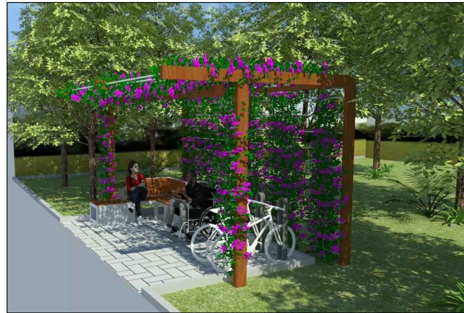
ÁREA DE DESCANSO PERSPECTIVA – NOVA PROPOSTA SEM ESCALA